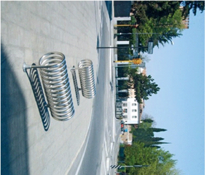
STOJAKI NA ROWERY